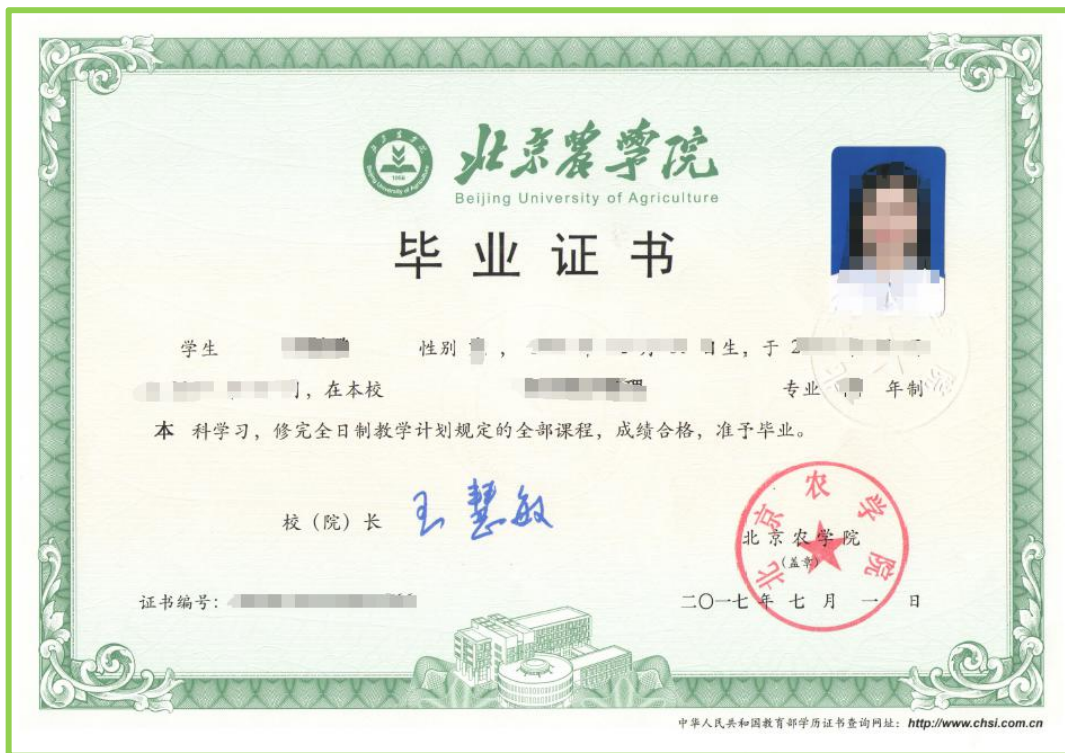
PDF 文档第 1 页，本科毕业证

第4步： 上传学历学位证原件扫描件（.PDF 格式），命名为“张三学历学位证”。须上传 全学段 学历学位证扫描件，即本科至博士阶段，如 未取得博士学历学位 须上传教育部学籍在线验证报告；每一个证书 独立扫描 后合并为一个 PDF 文档上传（该材料为办理入编及岗位聘用以及入档手续使用），如图：